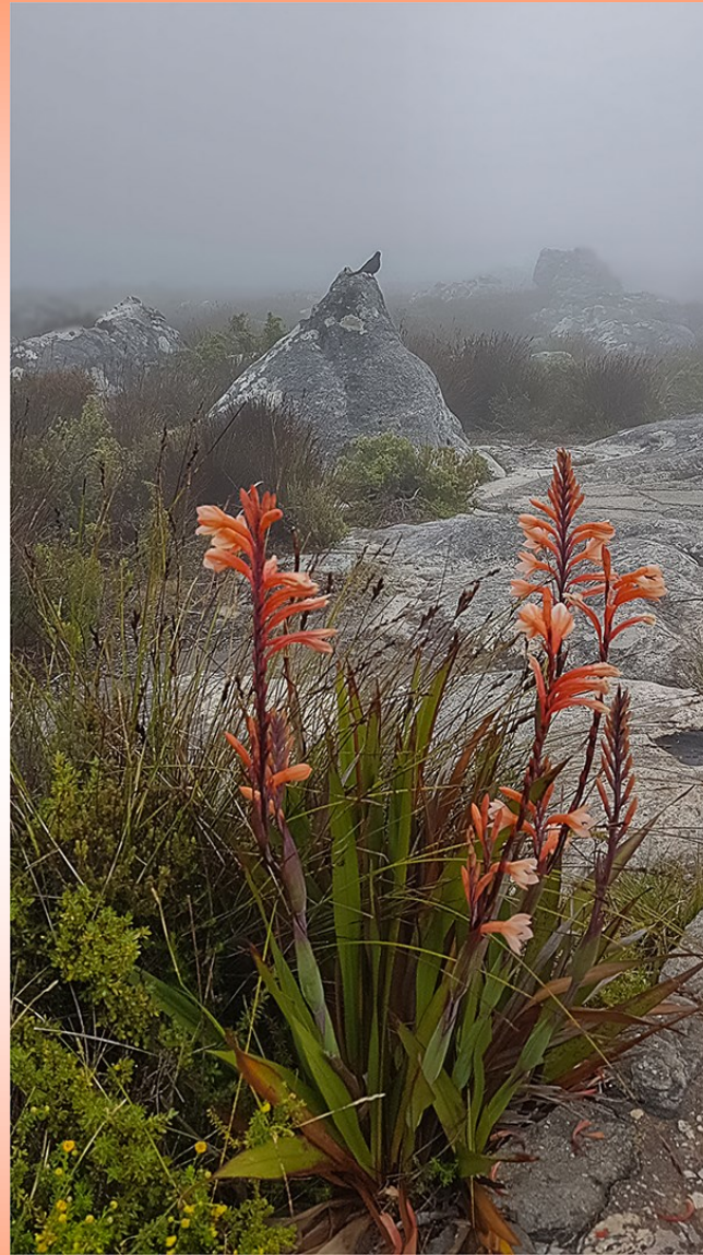
Wenner van Oktober se selfoonfoto - Ope - Nick van der Mescht