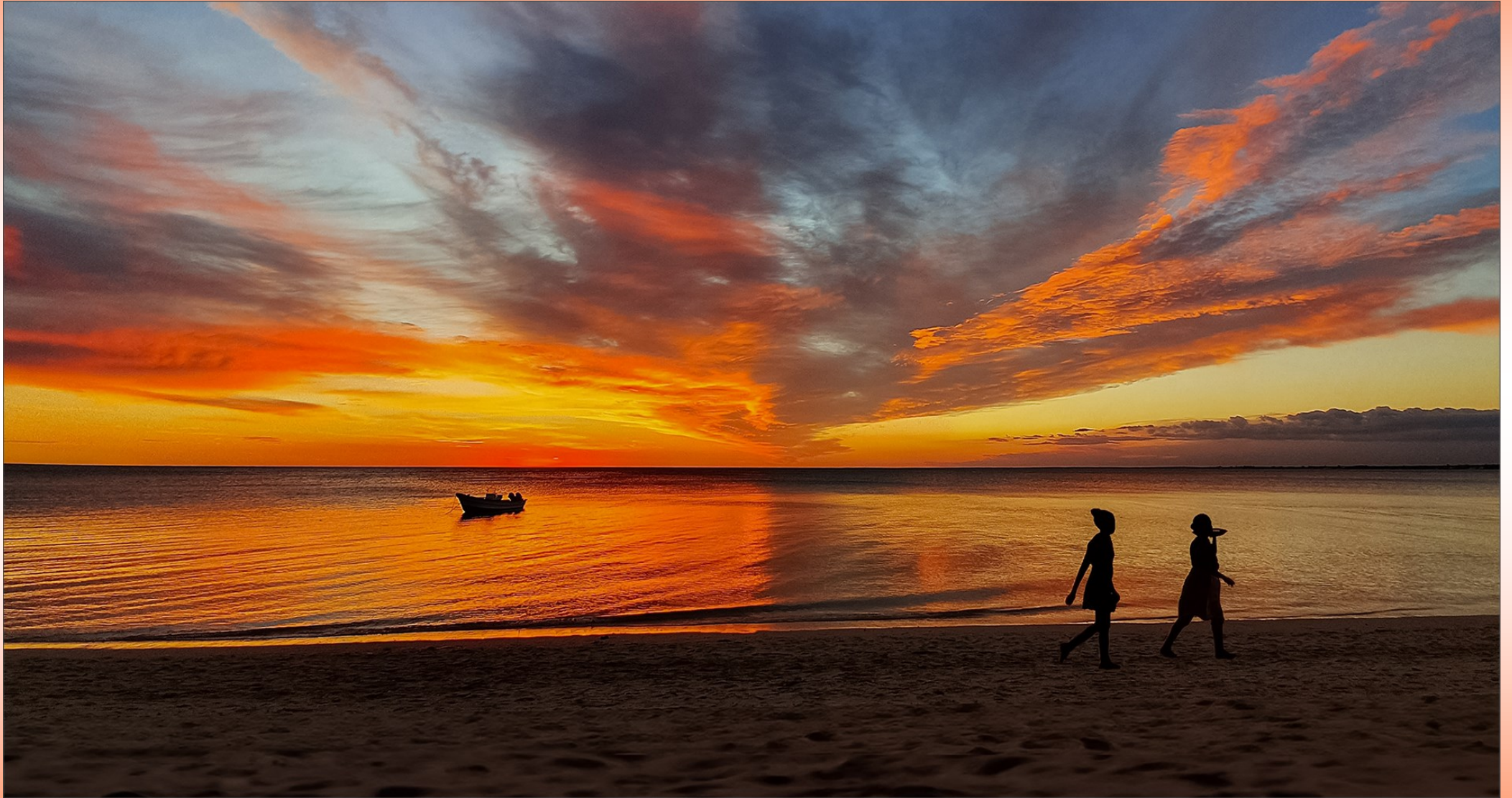
Wenner van Oktober se selfoonfoto - Tema - Silhoueët - Nick van der Mescht